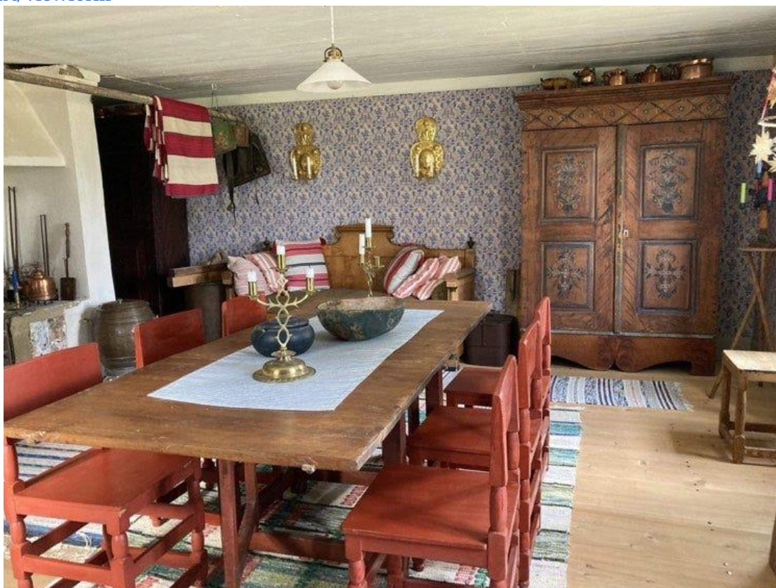
Interiörbild från Där Nol .

https://docs.google.com/forms/d/e/1FAIpQLScIci6xUA1BLYQTFtgAjzGLh28AT7ZxaXMMtwAhzKp5lPrLXA/viewform