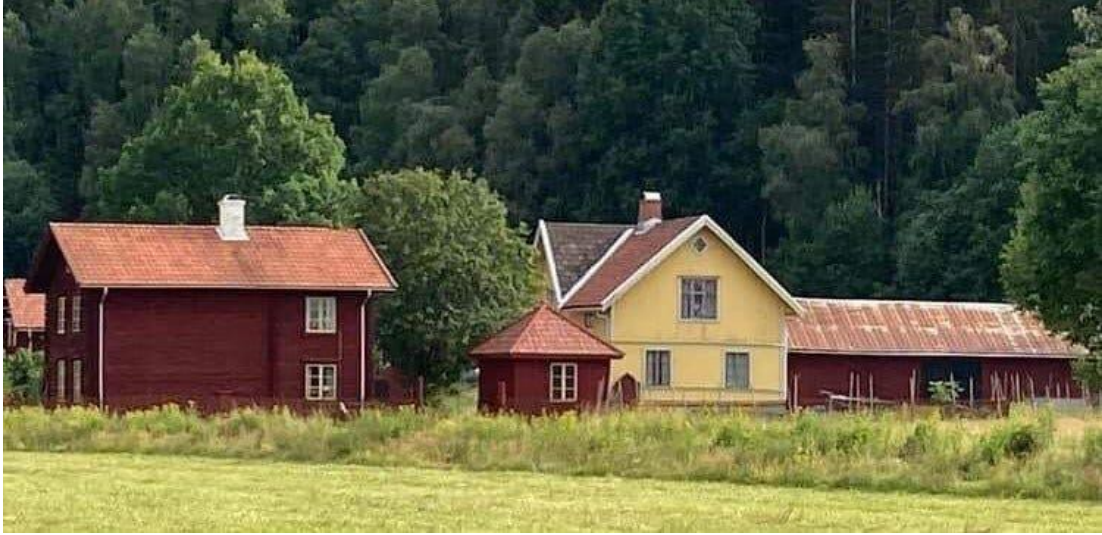
Gården Där Nol i Fastnäs, norra Klarälvdalen.